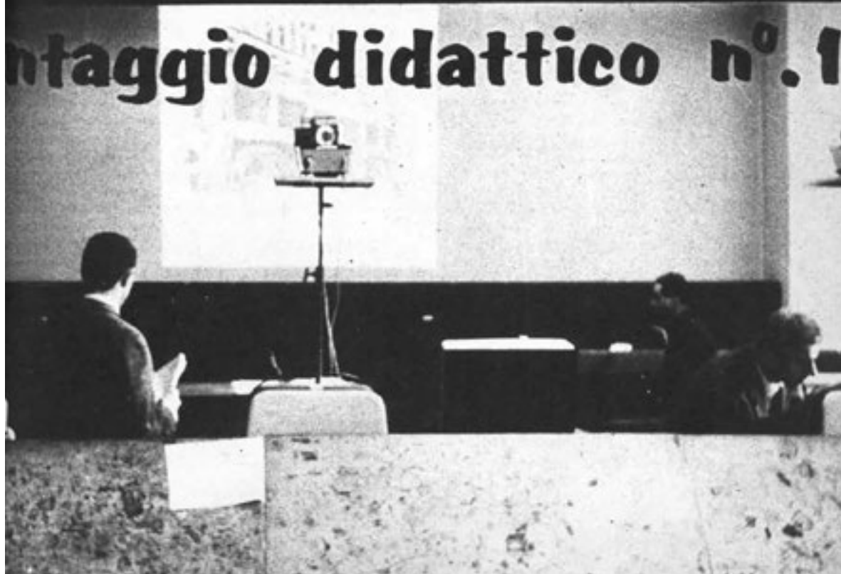
Montaggio didattico n° 1, 1965