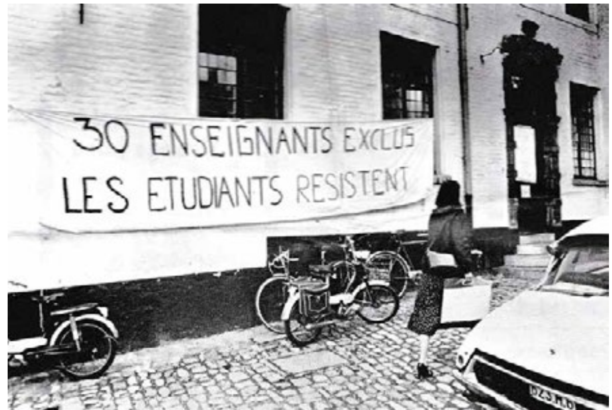
The Bulletin, 23 November/ november 1979