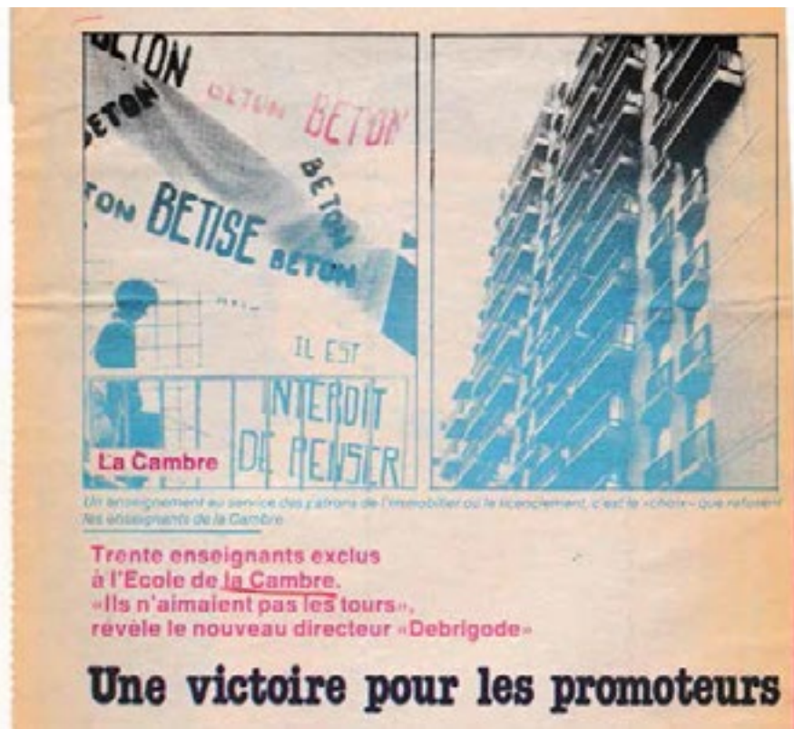
POUR, 10 April/ april 1979