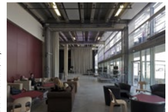
Multifunctional space in Le Grand Sud theatre, Lille / Multifunctionele ruimte in het theater Le Grand Sud, Lille