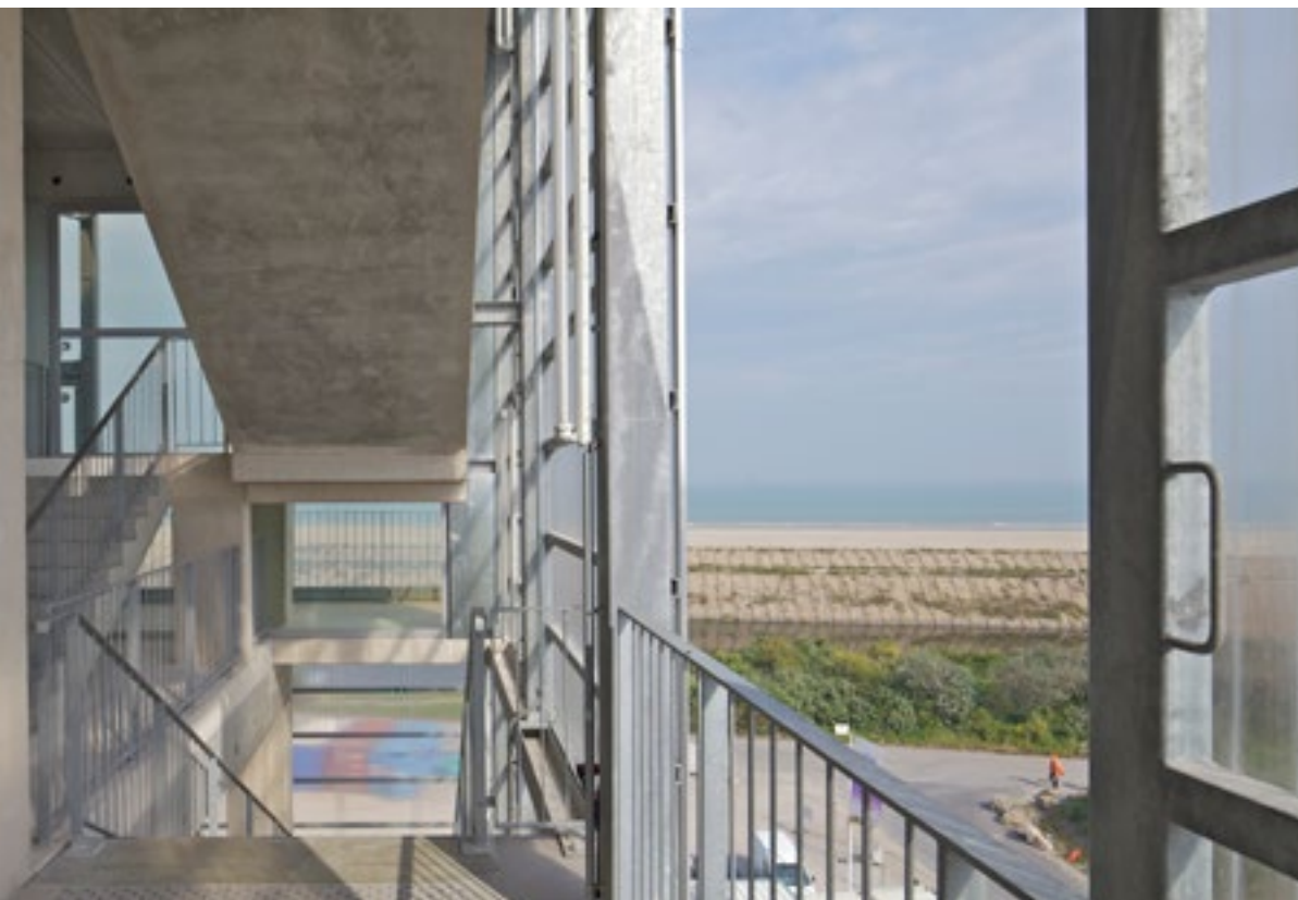
Staircase in the FRAC Nord-Pas de Calais, Dunkirk, with moveable transparent panels/ Trepthal in het FRAC Nord-Pas de Calais, Duinkerken, met verschuifbare transparante panelen

The new construction for the École Nationale Supérieure d’Architecture (ENSA) in Nantes (2003–2009) illustrates what this strategy can do for a collective building. The architects decided to realize twice the area strictly required. The structure of the building is initially determined by three immense floors of prestressed concrete that are laterally connected by a slanting plane that runs from the footpath to the roof terrace. The school is organized inside this maximum space, with recognizable rooms such as design studios, auditoriums or a library, but also including large unallocated floor surfaces or ‘multipurpose areas’ as they are called in the published plans. Especially the latter spaces express a pronounced generosity. They are metres-high open interiors that are in direct contact with the city in various ways: as extensions of the footpath on the ground floor, as internal squares inside the design school, and in the case of the extensive roof terrace as a sanctuary under the urban sky. Without users, the multifunctional spaces are as promising as empty industrial halls, but the designers also like to have them photographed with users in them. We see vast concrete floors to stand, walk, jump, build scale models, teach and party on, but above all, to explore the world from a partly familiar, but also provocative ‘inside’.