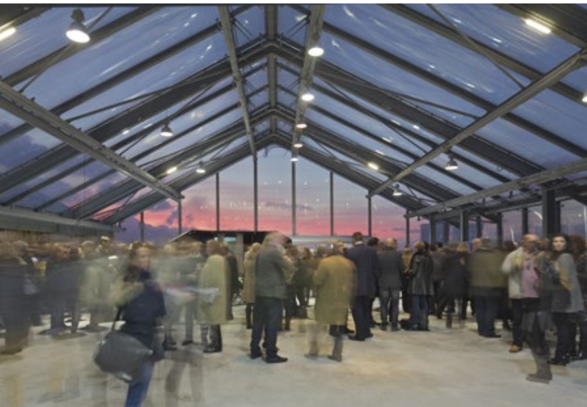
The belvedere of FRAC Nord-Pas de Calais, Dunkirk, with a transparent roof/ De belvedere van het FRAC Nord-Pas de Calais, Duinkerken, voorzien van een transparant dak

In the case of the FRAC, Lacaton and Vassal similarly distinguished between a building volume with a controlled climate — including the actual exhibition spaces and storage and administration spaces — and the surrounding spaces with a lower thermal inertia, such as the inner street, staircase and walled-in balconies. Standing inside those spaces one is inside and outside at the same time — inside the art centre and close to the sea. In publicly accessible buildings such as the FRAC, it is less self-evident that visitors can operate the awnings, shutters or panels themselves, but where this is