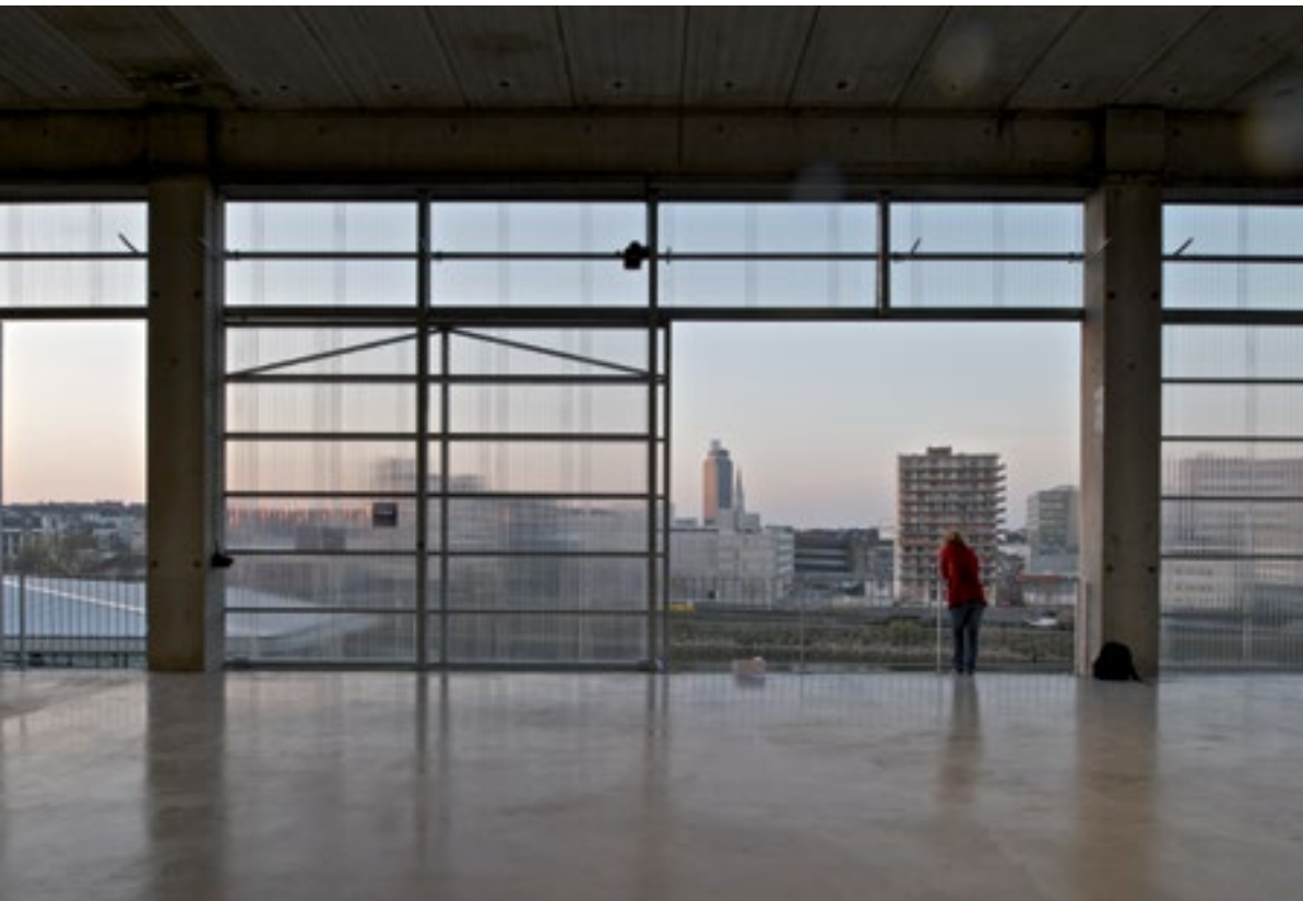
Interior view of the Ecole Nationale Supérieure d'Architecture, Nantes / Interieur van de École Nationale Supérieure d'Architecture, Nantes