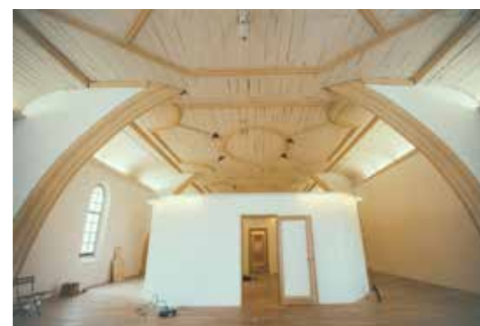
Patrick Bouchain, École du Domaine du possible , Arles, 2015. Last touch-up of temporary classrooms at Association du Méjan/ Patrick Bouchain, École du domaine du possible , Arles, 2015. De laatste hand wordt gelegd aan de tijdelijke klaslokalen in de Association du Méjan