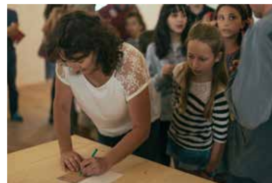
A parent signing the school charter / Een van de ouders ondertekent het schoolcharter

For two years, this school will most certainly be a place to experiment and live, to learn and create. Building upon Actes Sud's editorial activities, it will also be a place where children and educators engage in processes of re-telling and writing about their experiences, understood as crucial means of knowledge formation. This project is a highly risky endeavour; a contract of trust ( contrat de confiance ) – the school's charter – was signed by the founders and the parents as a means to share the responsibilities entailed. 6 As much as the learning activities will reconfigure the spaces where they take place, the