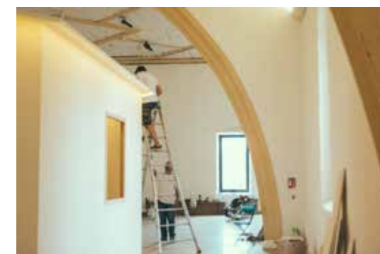
Patrick Bouchain, École du Domaine du possible , Arles, 2015. Temporary classrooms built within the space of a former chapel at Association du Méjan/ Patrick Bouchain, École du domaine du possible , Arles, 2015. Tijdelijke klaslokalen gebouwd binnen de ruimte van een voormalig kapel van de Association du Méjan