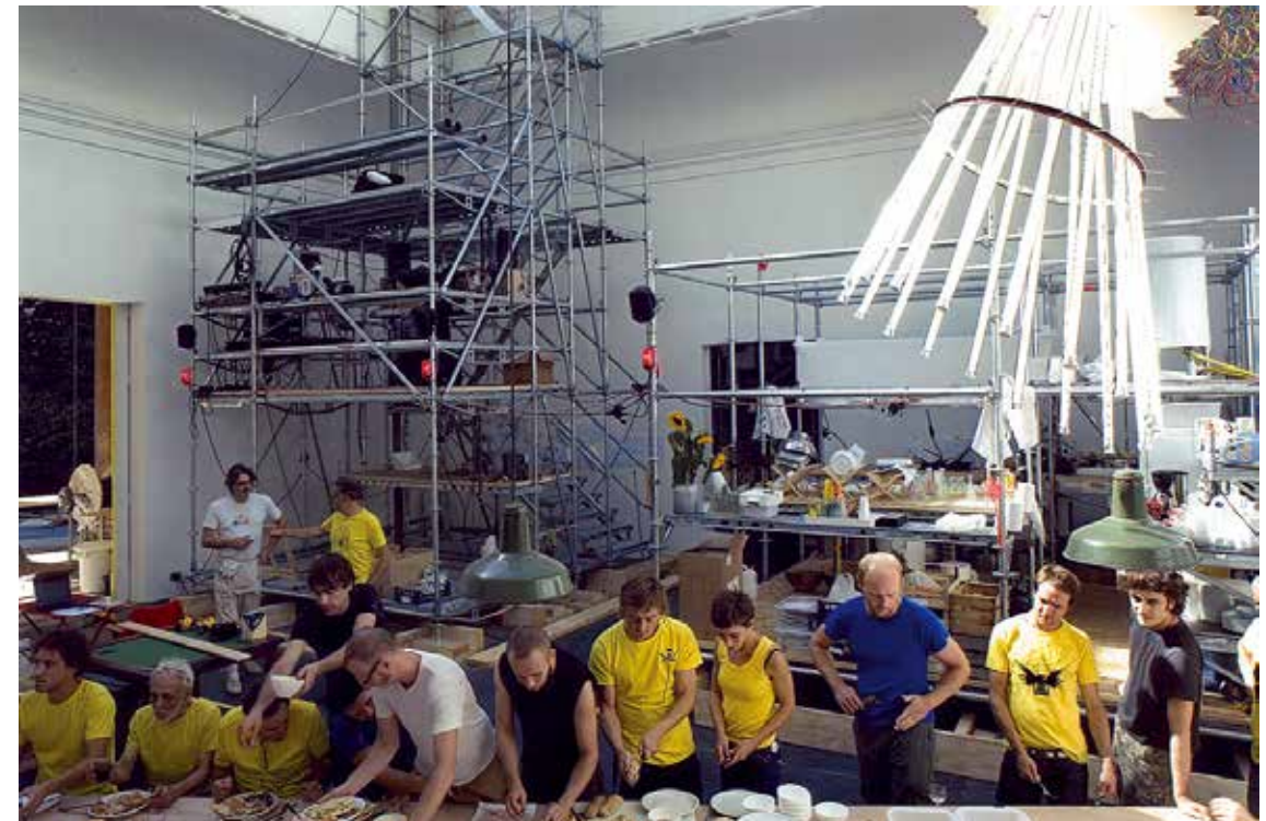
Patrick Bouchain & EXYZT, 'Metavilla', International Venice Biennale, 2006. Collective dining area/ Patrick Bouchain & EXYZT, 'Metavilla', internationale architectuuriënnale van Venetië, 2006. Gemeenschappelijke eetruimte

Het werk van Bouchain, dat zich in de marge van de toonaangevende architecturale stromingen ontwikkelt, wordt vaak als moeilijk te classificeren beschouwd. De uitgebreide hoeveelheid gebouwen en culturele projecten