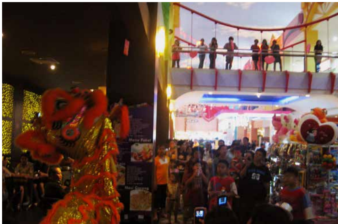
In their daily casual dress, people regularly visit the BCP shopping malls every day (Magali, Manado, Indonesia) / Mensen gaan in hun gewone kleren naar de BCP-winkelcentra (Magali, Manado, Indonesië)

De BCP-winkelcentra zijn, net als alle winkelcentra, speculatieve ondernemingen. In Manado namen minder ervaren lokale ontwikkelaars het voortouw. Zij hebben het potentieel van de lokale markt ernstig overschat, wat onvermijdelijk resulteerde in een wanverhouding met de feitelijke consumptieve capaciteit van de lokale markt. Tot nu toe is er van het totale BCP-stortplaatsterrein nog maar 24 ha bebouwd. De gebouwde winkelcentra op hun beurt zijn veel te groot. Het is eigenlijk de overmaatshouding van onder meer de overdekte binnenplaatsen, die kansen biedt om er andere activiteiten te organiseren en die mensen in staat stellen er afwijkende praktijken te laten plaatsvinden. In plaats van in winkelcentra veranderden de incomplete bouwlocaties in en rondom het BCP nu in terrains vagues : lege ruimten. Uiteenlopende groepen lokale bewoners vatten dat 'leeg' heel letterlijk op, als ware het een uitnodiging tot ingebruikname. Fysieke ruimte is tenslotte een open betekenaar; er kan altijd weer nieuwe betekenis aan worden gegeven. Elk winkelcentrum draagt hier ook weer aan bij door de openbare activiteiten van het winkelcentrum deels te laten plaatsvinden in deze lege buitenruimten. Er treden dus regelmatig muziekgroepen, acrobatische motorrijders, enzovoort op, zodat er afwisselend geësceneerde evenementen en spontane maatschappelijke gebeurtenissen in alle soorten en maten plaatsvinden.