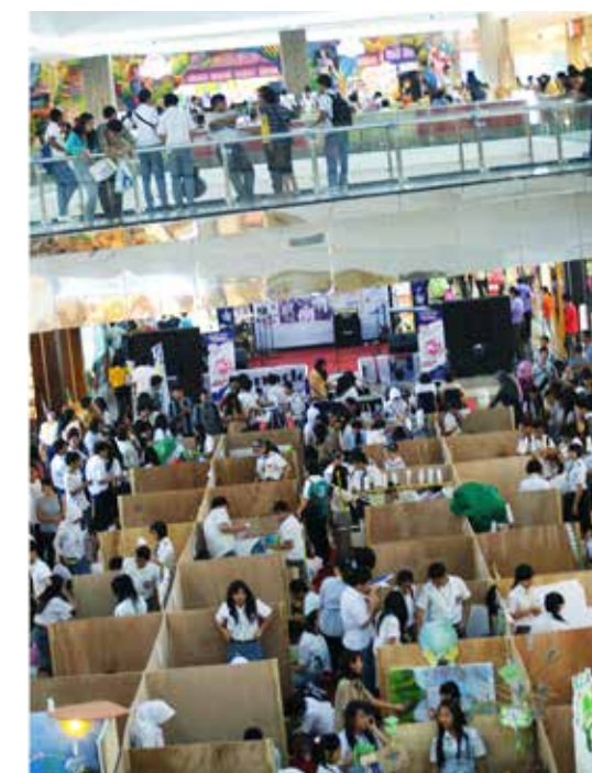
The yearly school competition takes place in the atria of Mantos Mall (Cynthia Susilo, Manado, Indonesia) / De jaarlijkse scholenwedstrijd vindt plaats in de atria van de Mantos Mall (Cynthia Susilo, Manado, Indonesië)