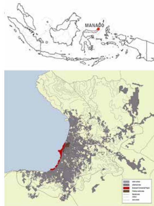
The location of the Megamall and the Mantos Mall in the BCP area (Cynthia Susilo, Manado, Indonesia) / De situering van de Megamall en de Mantos Mall op het BCP-terrein (Cynthia Susilo, Manado, Indonesië)

Such shopping malls instantly generate a duality – new land versus old city – and act as the mirror of development. All elements are thus in place to claim that these malls are