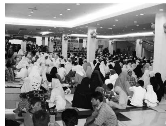
The PAN, a political party, invited several Muslim groups to the Megamall to attend an event that was a mix of both electoral campaign and religious gathering (Manadopost, Manado, Indonesia) / De PAN, een politieke partij, nodigde een aantal islamitische groepen uit om in de Megamall een bijeenkomst bij te wonen, die het midden houdt tussen een verkiezingscampagne en een religieuze bijeenkomst (Manadopost, Manado, Indonesië)