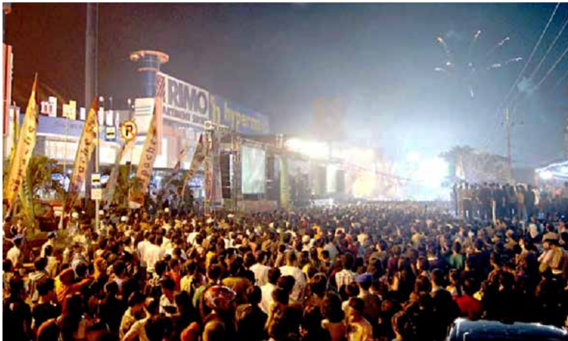
The city's official New Year's event has taken place in the BCP area since 2012 (Pemda Kota Manado, Manado, Indonesia) / Het officiële Nieuwjaarsevenement van de stad vindt sinds 2012 plaats op het BCP-terrein (Pemda Kota Manado, Manado, Indonesië)

7 Sinds 2009 worden er jaarlijks 13 officiële openbare evenementen georganiseerd. Acht hiervan vonden vooral plaats op het BCP-terrein (geregistreerd door de gemeente Manado).