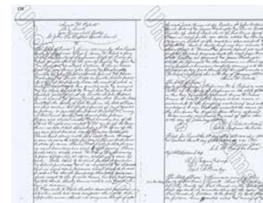
Saint John's conditional land deed signed in 1900. Fort Bend County Clerk's Office/ De voorwaardelijke grondacte van Saint John, getekend in 1900. Kantoor van Fort Bend County Clerk's