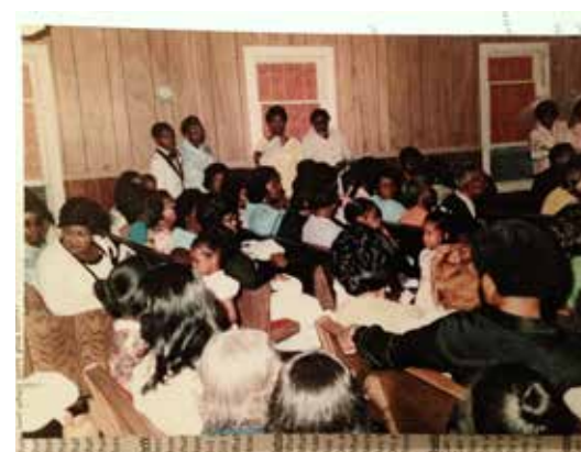
Saint John on a Sunday morning, 2014/ Saint John-kerk op een zondagochtend, 2014