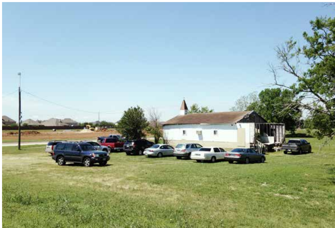
Saint John on a Sunday morning, 2014/ Saint John-kerk op een zondagochtend, 2014

Hoewel Freedmen dus te maken hadden met een eigendomssysteem dat gekenmerkt werd door exclusiviteit en autonomie, gebruikten ze het land van hun kerken om collectiviteit en wederzijdse verbondenheid op te bouwen. Onderzoek van historicus Dylan Penningroth laat zien dat slaven in het Zuiden nondescripte bouwsels transformeerden tot waardevolle bezittingen, door ze aan andere mensen te verbinden en ze zichtbaar te maken voor publiek. 6 Voor slaven had zulk 'eigendom' waarde, omdat het vormen van verplichting, verwantschap en 'erbijhoren' genereerde. 7 Wanneer we dit doortrekken naar