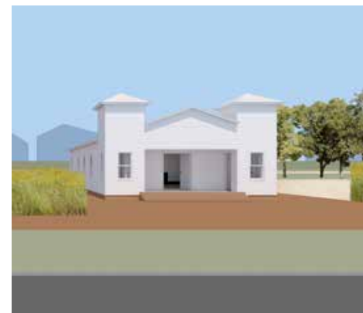
Revitalisation vision for the Saint John church/ Voorstel voor de vernieuwing van de Saint John-kerk Drawing/Tekening Gabriel Cuéllar

delen. De nog bestaande Freedmen kerken bieden gezamenlijk kans op een verbinding tussen de politiek van het vastgoed en een vorm van architectuur die zich daartegen afzet.