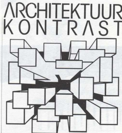
Eerste tentoonstelling studentenprojecten en -oefeningen '83-'84. Presentatie plannen, diashows, video, films, discussies.