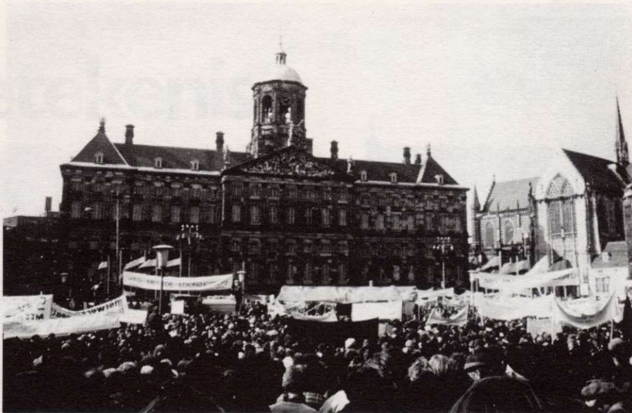
FNV-demonstratie op de Dam.

Op deze manier blijft het echter nog een verstild stenen tekenritueel. Maar bij speciale gelegenheden wordt dit ritueel geactualiseerd. Dan openbaart zich even de inzet van het drama. Zo was de Inhuldiging op 30 april 1980 bij uitstek een scenario om dit versteende symbolische theater tot leven te wekken. Tot ver buiten ons land heeft men via de televisie kunnen aanschouwen hoe dit schouwspel werd opgevoerd. Hoe de eenheid van een volk in levende lijve(n) in scene werd gezet. In het aanschijn van de te kronen vorstin werd iedere laag van de bevolking ordentelijk zijn plaats gewezen. De uitverkorenen uit het volk op stoeltjes voor het paleis, gezagsdragers en hoogwaardigheidsbekleders in de Nieuwe Kerk en de genode koninklijke gasten in het paleis. Een koninklijk baldakijn verbond paleis en kerk die zo hun centrale plaats in het gebeuren kregen. Een enorme politiemacht schermde het geheel af van het plebs.