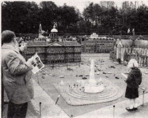
De Dam in Madurodam.

De ornamentiek van het paleis is bedaarder en evenwichtiger. Maar de indrukwekkende wijze waarop de voorgevel het plein overheerst spreekt al boekdelen. Alles draait om de centrale positie van het paleis. Het paleis maakt dat de Dam geen gewoon Amsterdams plein is, maar als geheel een nationaal symbool. Daar hoort ook de zich ter rechterzijde van het paleis bevindende Nieuwe Kerk bij. Enerzijds is de kerk een monument voor het Geloof dat de natie door alle rampspoed zal loodsen. Anderzijds wordt in het gebouw zowel in figuurlijke als in letterlijke zin de eenheid