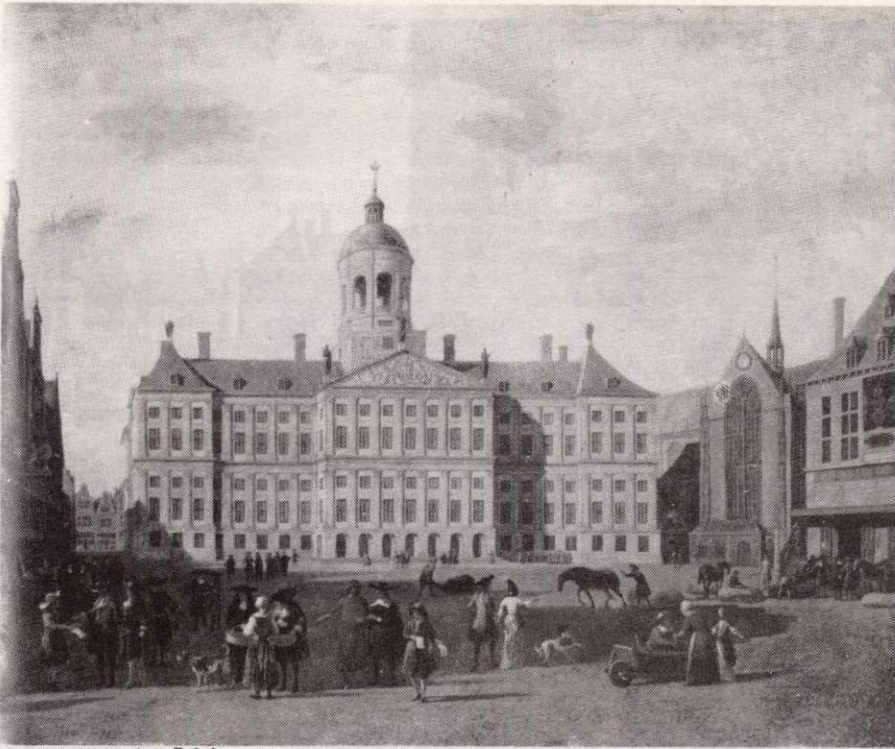
Schilderij van het Paleis.