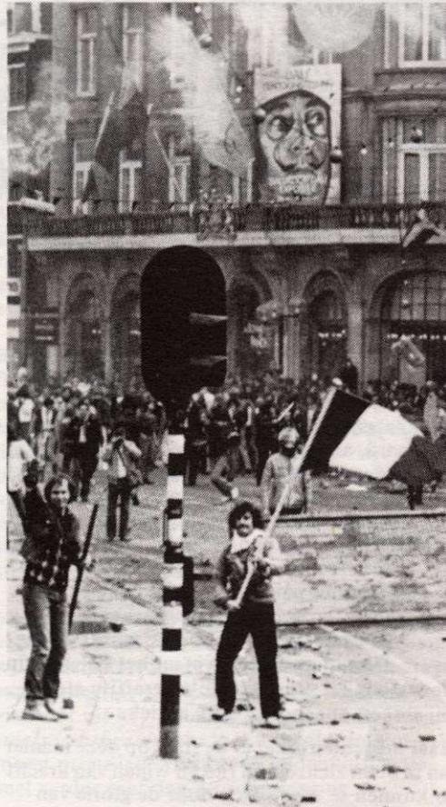
Rellen op het Damrak.

De politiemacht legde hierop een zwaargewapend kordon om het gezagsgetrouwe kroningspubliek en de gezagsdragers. Vervolgens mocht het Amsterdamse gepeupel in alle vrijheid van de rest van de stad bezit nemen. De sterke arm mocht zelfs een paar uur lang met stenen worden bekogeld. Dit alles was echter niets anders dan een toegestane vrije expressie van lust- en onlustgevoelens die de overheid en de media al maanden lang hadden aangekweekt en opgezweept. Lang van te voren was er al op gerekend dat de stad op onverantwoorde wijze van haar losbandigheid zou gaan genieten. Grootscheeps werd de ME - de staatsordediens - getreiterd. En 's avonds mochten de ME-ers die zich een middaglang als pispaal hadden moeten laten gebruiken op hun beurt hun