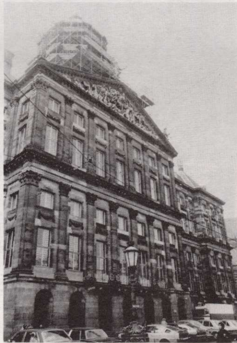
Fronton en balkon.

koopvaardij in top dat aangeeft dat de zeevaart Holland hoog zal houden; de Hercules aan de achterkant die zelfs de hele wereld in evenwicht houdt en tenslotte de - later toegevoegde - kroontjes op de hoeken van het dak, die het gebouw een koninklijke status hebben verleend.