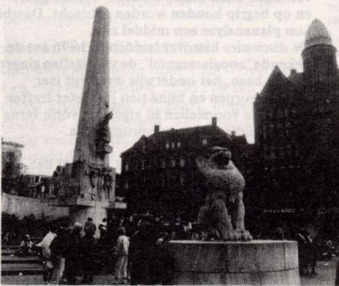
Het nationaal monument op de Dam.