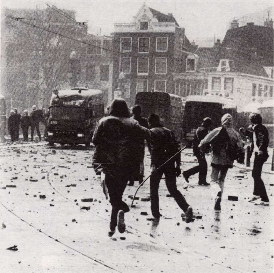
Inname van de blauwe brug op het Rembrandtplein.

De al te nadrukkelijke afscheiding ontlokte echter een spontane tegenreactie op het kroningsritueel. Hierop was al weken lang door de media gespeculeerd. Al vooraf werd de aanleiding gezocht in de al maandurende onrust in de stad vanwege de kraakacties. Een demonstratieve optocht zette voet richting Dam voor een confrontatie met de oranjeklanten. Dit werd de aanleiding voor de bizarre afloop van de festiviteiten die echter aan het televisie- en oranjeminnend publiek werd onthouden. Eerst werd het Rembrandtplein ingenomen. Bij monde van de popgroep Drukwerk sloeg de 'Verveling in Amsterdam-Noord' warempel om in de revolutionaire stemming van de Internationale.