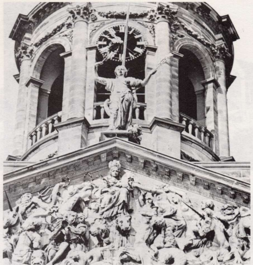
Details van het Paleis: Stedenmaagd, Vrouwe Justitia, Koopvaardijsschip.

Toch wordt er door de staat zeer nadrukkelijk geïnvesteerd in een aantal tekenrituelen en symbolen terwijl iedereen ervaart dat er nauwelijks nog enige betekenis aan kan worden