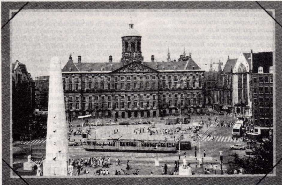
Vooraanzicht van het Paleis.

tussen volk en gezagsdragers bekrachtigd. Paleis en kerk kunnen niet gescheiden worden gezien.