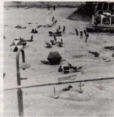
Het naaktstrand in Madurodam.