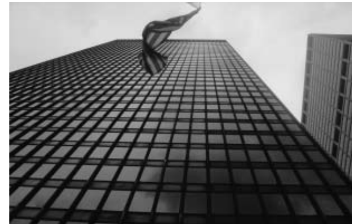
Seagram Building, New York. Ludwig Mies van der Rohe, architect; Philip Johnson, associate architect; Phyllis Lambert, director of planning, 1958 / Seagram Building, New York. Ludwig Mies van der Rohe, architect; Philip Johnson, uitvoerend architect; Phyllis Lambert, verantwoordelijk planner, 1958