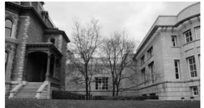
Library wing of Canadian Centre for Architecture and the restored Shaughnessy House. Peter Rose architect; Phyllis Lambert consulting architect; Erol Argun associate architect, 1989 / Bibliotheekvleugel van de Centre Canadien d'architecture en het gerestaureerde Shaughnessy House. Peter Rose architect; Phyllis Lambert adviserend architect; Erol Argun uitvoerend architect, 1989