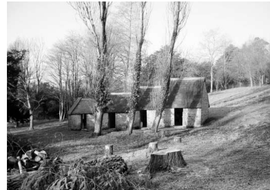
Cedric Price was involved in the renovation of the former dog kennel, which is now inhabited / Cedric Price was betrokken bij de renovatie van het voormalige hondenverblijf dat nu bewoond wordt