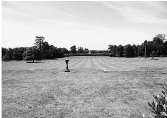
Hadspen House, Somerset, England, the main axis viewed from the terrace of the house / Hadspen House, Somerset, Engeland, de hoofdas gezien vanaf het terras van het huis

De strip met gewassen moet je, in zijn voorgestelde oriëntatie en lengte, zien als een snede door het hele landschap van het landgoed. Hij loopt door bos, moestuin en siertuin, achttiende-eeuws landschapspark, bouwland, een grote openbare weg, verlaten of in onbruik geraakte paden. En hij probeert een nieuw aangelegd meer en een ruïneuze boerderij te incorporeren. Die boerderij is momenteel trouwens onderwerp van een ‘poging’ tot hergebruik. De boerderij grenst aan de westzijde aan de (visueel onbevredigende) lange grens van de Avenue: deze strekt zich