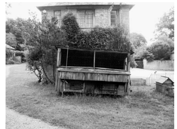
Henhouse / Kippenstal