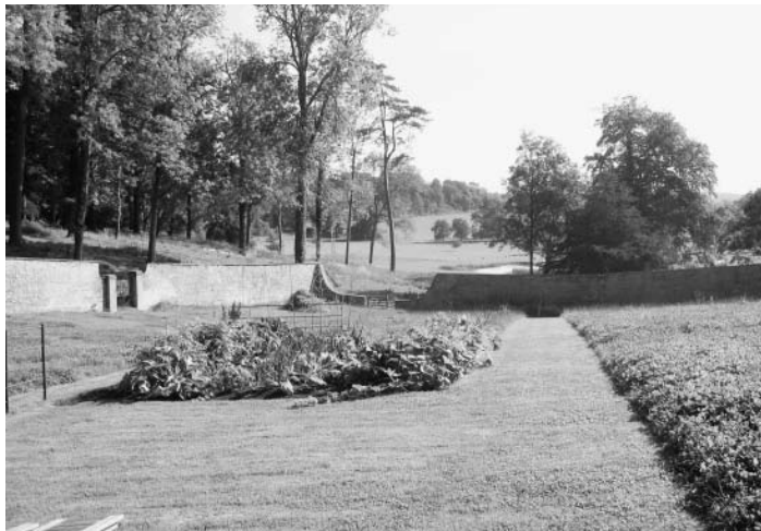
Part of the garden is surrounded by a wall following the line of a parabola / Een deel van de tuin is omgeven door een muur die een paraboolvormige lijn volgt

Landgoed Hadspen bestaat uit ongeveer 300 hectare gemengd landbouwbedrijf en bos, gecentreerd rondom een groot landhuis, samen met nog eens 20 woningen en bijgebouwen. Veel van die gebouwen, en het architectonische ensemble rond huis en tuin, 'genieten' bescherming als monument. Vanaf de zeventiende eeuw zijn alle gebouwen onderhevig geweest aan een voortdurend proces van verandering, aanpassing of uitbreiding. Het ingerichte landschap rond het hoofdhuis is uitgebreid, en vertegenwoordigt majeure ingrepen, laag op laag, vanaf de late zeventiende,