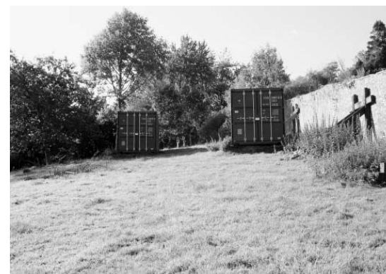
Standard containers placed in the garden are used as library and reading room for the inhabitants of the house / Standaard containers in de tuin worden gebruikt als bibliotheek en leeskamer voor de bewoners van het huis