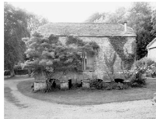
The ensemble of the house includes stables and a variety of seventeenth-century barns and granaries that are now inhabited / Bij het ensemble van het huis horen ook stallen en enkele zeventiende-eeuwse schuren en andere bijgebouwen die nu worden bewoond