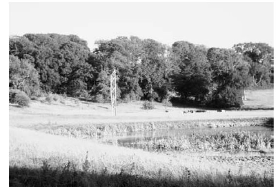
Cows grazing around the obelisk, the last realised project in England by Peter Smithson / Koeien grazen rondom de obelisk, het laatste gebouwde project in Engeland van Peter Smithson