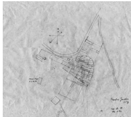
Florian Beigel, sketch (July 2009) for ordering and connecting the Parabola Garden to the wider landscape / Florian Beigel, schets (juli 2009) van een reorganisatie en verbinding van de Parabola Garden met het omringende landschap

What is this operation of gardening going to do? And is this to invite the designers to leap into the dark and face the consequences – with an unpredictable outcome? For the architects this may be a somewhat disconcerting prospect, since although there is a professed desire to be given a free hand, when it is actually there (is it?), the constraints – certainties – that come with most jobs seem to be absent. How do you view your own responsibility in this? The ambition – an examination of how the land may be used/occupied – is fairly substantial, yet the guidelines are formulated as a set of loosely connected hypotheses in need of a coherent form. I would like to interest you in providing one.