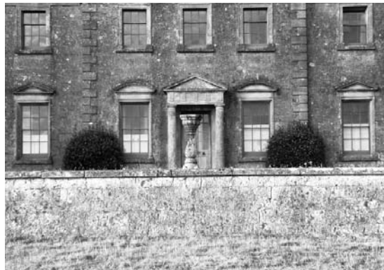
The house was originally built in the seventeenth century, but has since undergone several major changes / Het huis dateert oorspronkelijk uit de zeventiende eeuw, maar werd verschillende keren verbouwd