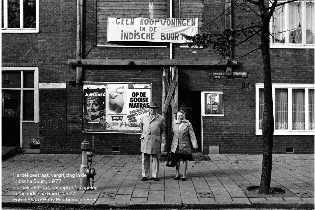
Harokoestraat, vergrijzing in de Indische Buurt, 1977. Harokoestraat, demographic ageing in the Indische Buurt, 1977.