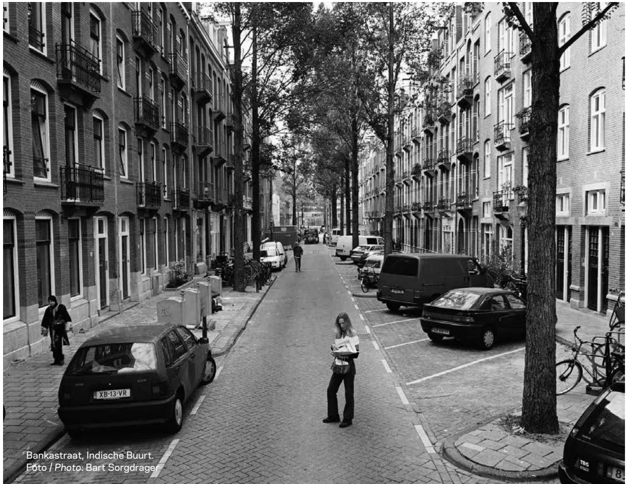
Bankastraat, Indische Buurt.