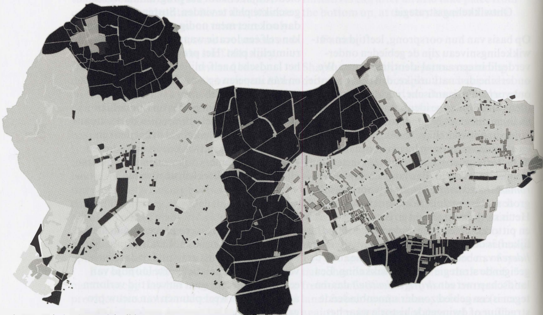
Romantic West Friesland: nostalgic ribbons in the emptiness