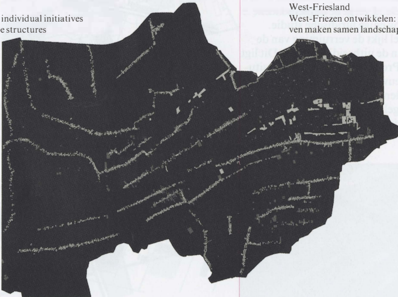
West-Friesland West-Friezen ontwikkelen: individuele initiatieven maken samen landschappelijke structuren