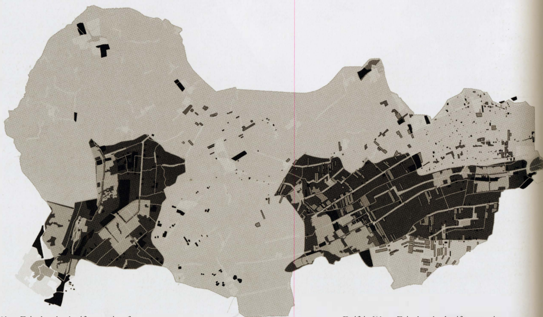
Volatile West Friesland: pluriform mix of individual programmes