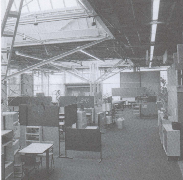
School zonder muren / School without walls School met muren, 2001 / School with walls, 2001