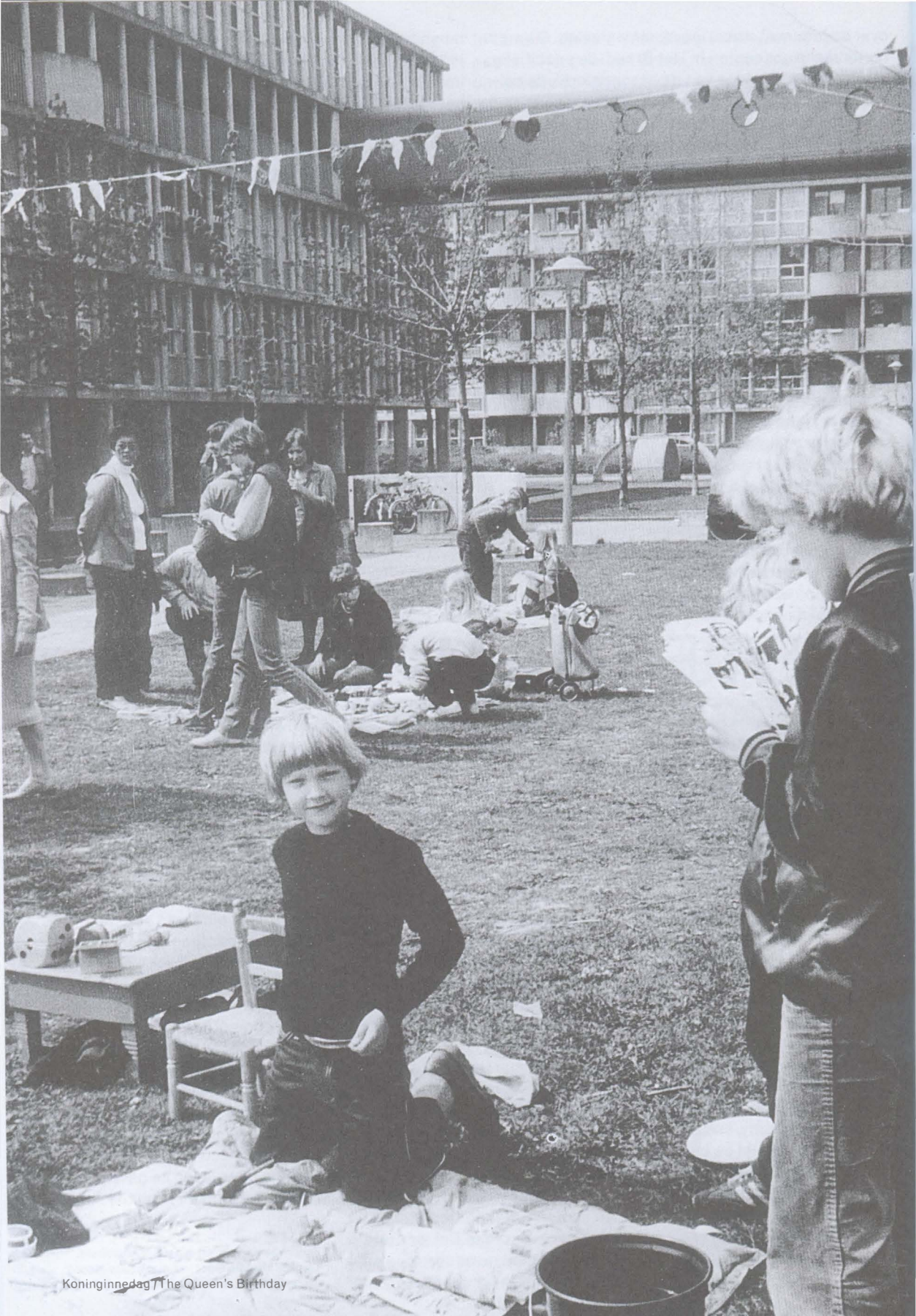
Koninginnedag / The Queen's Birthday