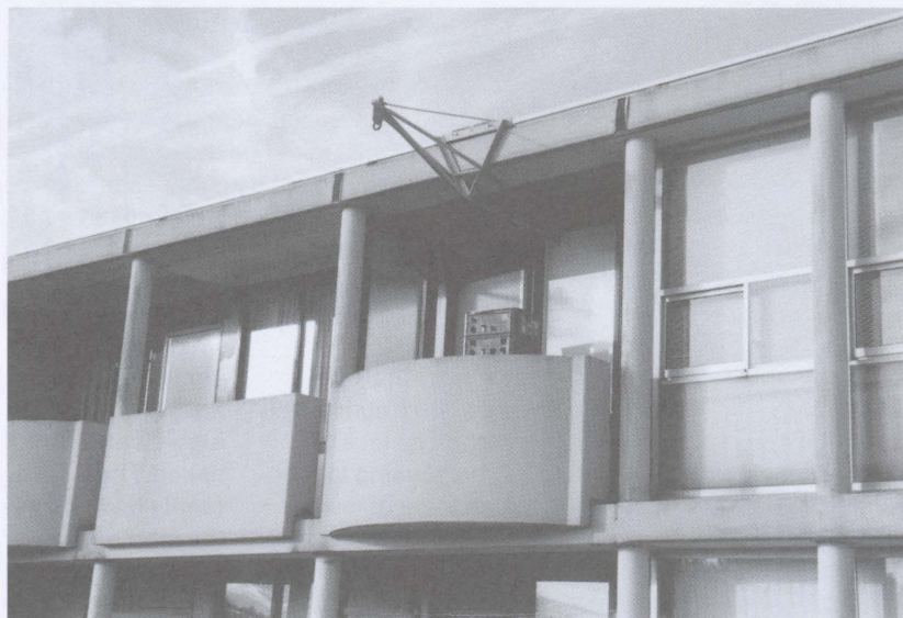
Zelfgemaakte hijsbaak / Self-installed lifting beam

Het Breed zelf laat zien dat een flatwijk wel degelijk een leefbare wijk met een sterke sociale structuur kan zijn. Uit haar geschiedenis blijkt dat de maatschappij inderdaad niet 'maakbaar' is met ruimtelijke middelen; het tegendeel, dat de ruimtelijke en sociale structuren geen invloed op elkaar hebben gehad, is echter ook niet waar. Tussen het ruimtelijke en het sociale zal altijd sprake zijn van enige 'frictie' en om een dergelijke flatwijk ook voor de