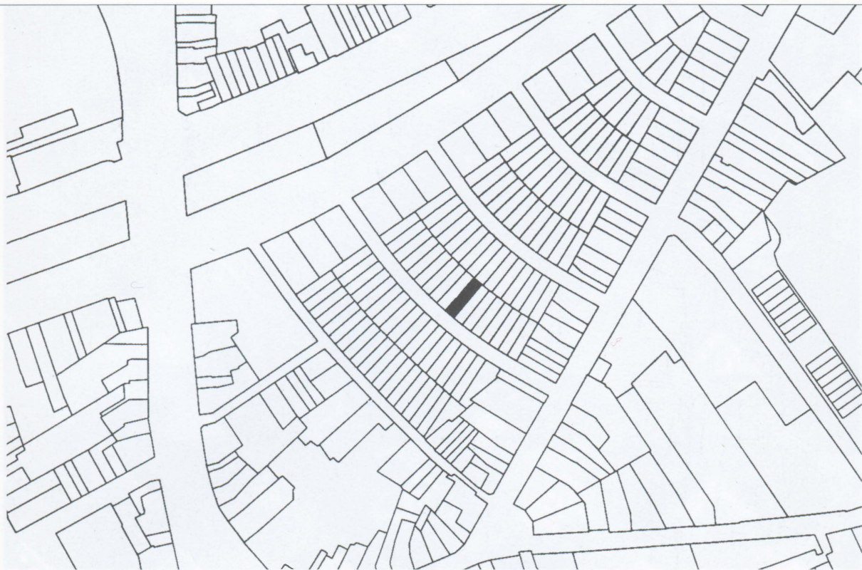
H. Kollhoff, ontwerp Tilburg Kompleet, stedenbouwkundig plan