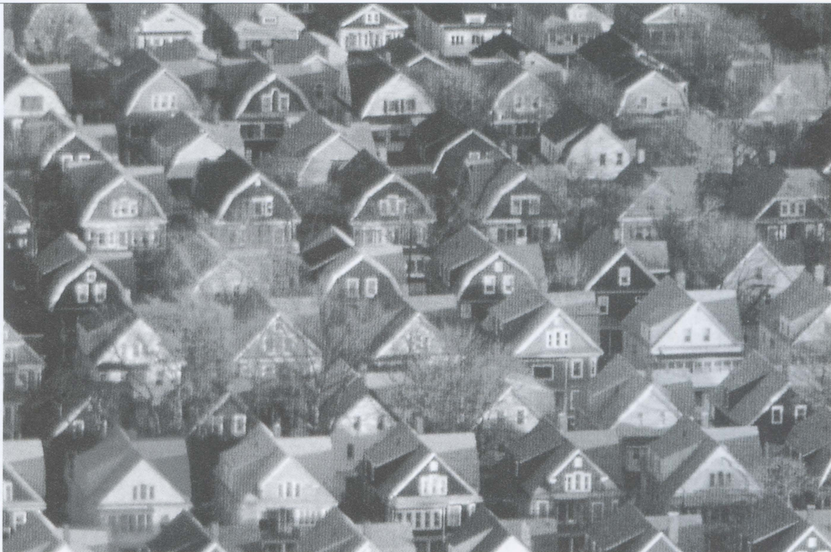
Anonymus, de 'American Way of Life'