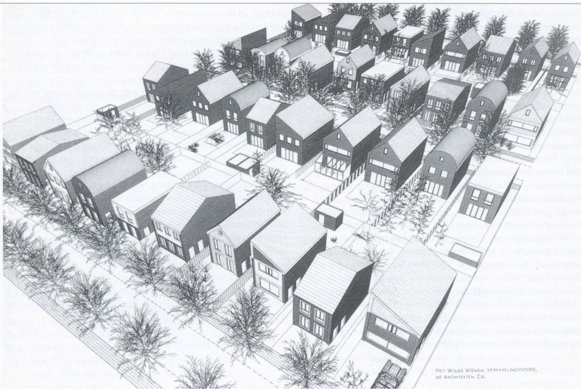
HET WILDE WONEN, VERKEVELINGSSTUDIE, DE ARCHITECTEN CIE.