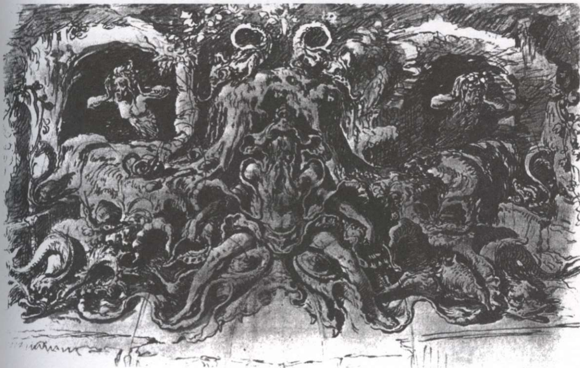
Jacques de Gheyn II, tuin van prins Maurits in 's-Gravenhage, ontwerp voor de 'grotto'

In 1621 begon Blaeu met de eerste metingen die moesten leiden tot een bepaling van de omtrek van de aarde. Willebrord Snellius had dat een paar jaar eerder al gedaan, maar zijn werk was niet voldoende nauwkeurig geweest. In hetzelfde jaar begon Maurits met de aanleg van zijn hortus conclusus . Van Oldenbarneveld is dood, net als de vele duizenden (Spanjaarden, Walen, Zwitsers en een enkele verdwaalde Nederlander) op die dag van de Slag bij Nieuwpoort. Wellicht, het is alles slechts hypothetisch, heeft Maurits in zijn laatste levensjaren gedroomd van een tuin waarvan de grenzen samenvallen met die van de wereld. De omheining die de tuin moet afschermen voor wat daar buiten is, heeft de nu archaisch geworden gedaante van een door witte arduinstenen kantelen bekroonde bakstenen muur. De indeling van het grondstuk dat door deze muur wordt omsloten, volgt de hoofdlijnen van de eerder door Blaeu op pregnante wijze weergegeven 'Nieuwe en nauwkeurige kaart van de hele wereld'. De kleine, in plattegrond cirkelvormige priëlen tussen de beide grote cirkels van de tuin zullen corresponderen met de op de overeenkomstige plekken op de kaart van Blaeu aangebrachte personificaties van de vier elementen: lucht, water, vuur en aarde. De plaats van de vierkante priëlen komt dan overeen met die van de vier seizoenen zoals deze staan afgebeeld in de zwikken van de kaart. Zoals de plattegrond van de tuin laat zien, staat