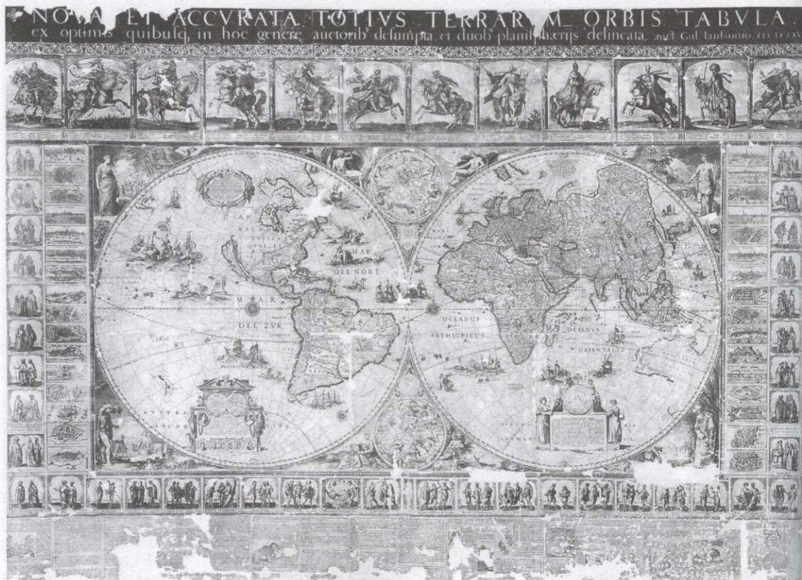
Willem Janszoon Blaeu, 'Nieuwe en naukeurige kaart van de gehele wereld', 1619 (editie van 1646)

Rond 1600 werden de grenzen van de nog jonge Republiek der Zeven Provinciën aangeduid als 'De Hollandse Tuyn'. Deze benaming had allereerst betrekking op de krans van fortificaties, onder leiding van prins Maurits aangelegd of veroverd door het Staatse leger, maar zal ook hebben verwezen naar de nieuwe inrichting en bloei van het grondgebied binnen deze omheining. De Hollandse Tuin werd allegorisch verbeeld door een cirkelvormig tenen vlechtwerk met daarbinnen de Hollandse Maagd en aan de rand, bij het hek, de Hollandse Leeuw. Buiten dit gevlochten staketsel ligt een maar ten dele