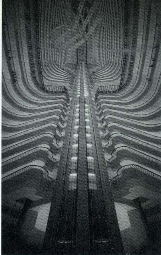
Atlanta Marriott Marquis Hotel, atrium over vijftig verdiepingen