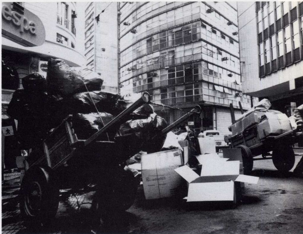
Straatbeeld, Brazilië

De Braziliaanse arme is in dit proces verwickeld buiten zijn wil en zonder plan. Hij participeert door middel van een toegevoegde eigenschap, een excès van zijn wezen: zijn aanwezigheid. Dat is de aanslag van het zijn.